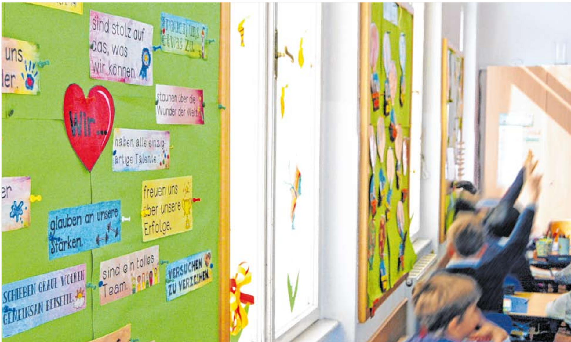
Der Religionsunterricht als Dienst an der weltanschaulichen Orientierung der ihm anvertrauten Kinder und Jugendlichen.