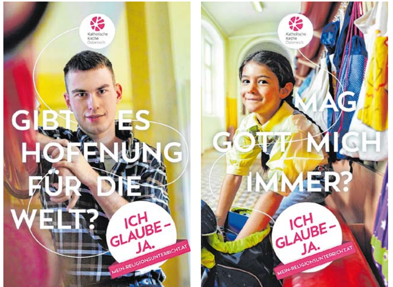
Mit einer Kampagne rückt die Katholische Kirche die Bedeutung des modernen Religionsunterrichts in das Blickfeld der Öffentlichkeit und räumt mit veralteten Bildern auf.